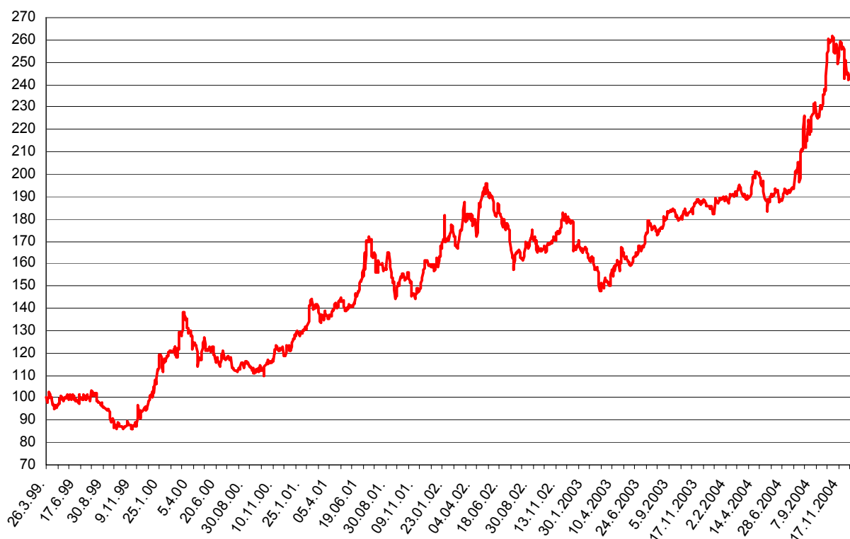
Slika 2 - Kretanje NIV-a Kapitalnog fonda od 26. ožujka 1999. do 31. prosinca 2004.

U skladu sa strategijom Kapitalni fond je tijekom 2004. realizirao daljnja ulaganja u inozemne dionice u srednjoj i istočnoj Europi kako bi se stvorio atraktivniji i kvalitetniji proizvod. Udio stranih dionica u portfelju Kapitalnog fonda iznosi 21%.