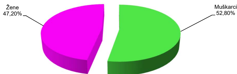
Struktura osiguranika prema spolu